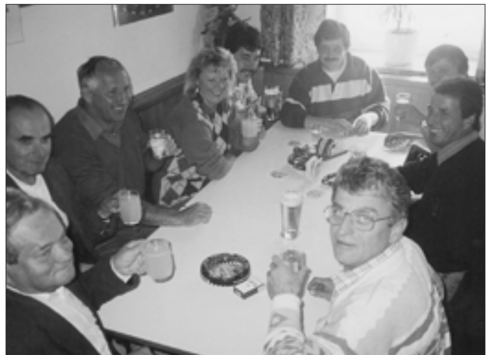
Nach dem Scharfschießen am Feliferhof trafen sie die Schützen zu einem gemütlichen Beisammensein.