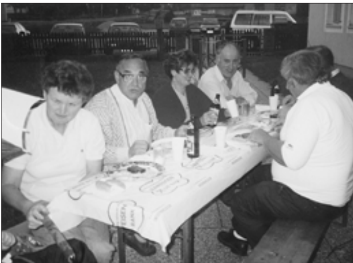
Der alljährliche Grillabend, zu dem auch die Frauen der Kameraden eingeladen sind, dient der Pflege der Kameradschaft.

Die Gemeinde Wundschuh läßt von der jeweiligen Gemeindezeitung immer etliche Zeitungen mehr drucken. Holen Sie im Gemeindegamamt ein, zwei Exemplare nach und verschicken Sie diese an Ihre Verwandten. Diese werden sich sicher darüber freuen.