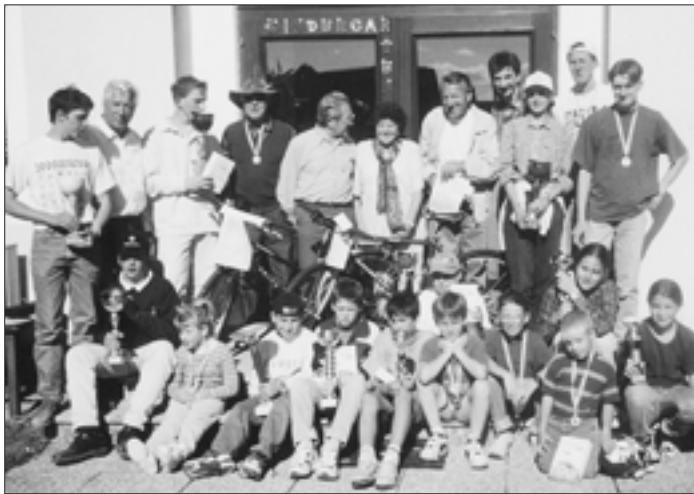
Die Verlosung wertvoller Preise stellte wieder den Höhepunkt des Radtages dar.

mern Bäume und Sträucher geschnitten. Am 8. März fand die Jahreshauptversammlung im GH Farmer statt. Höhepunkt war der interessante Vortrag von Friedrich Haritsch über Zierpflanzen und -bäume im Garten. Am 8. Juni führte uns der erste heurige Ausflug nach Ungarn. Wir besichtigten die Stadt Keszthely und das dortige wunderschöne Schloß, hatten eine Weinkost in Szigliget, sahen die Ritterspiele in Sümeg, wo wir auch ein tolles Ritteressen einnahmen. Unseren zweiten Ausflug führten wir gemeinsam mit dem Fremdenverkehrsverein am 8. Juli durch. Mit über 100 Teilnehmern besuchten wir unsere schönsten steirischen Blumendörfer. Am 6. August führte der Obstbauverein wieder bei Familie