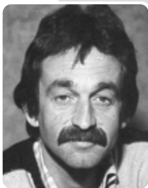
Dir. Heinz Reinisch