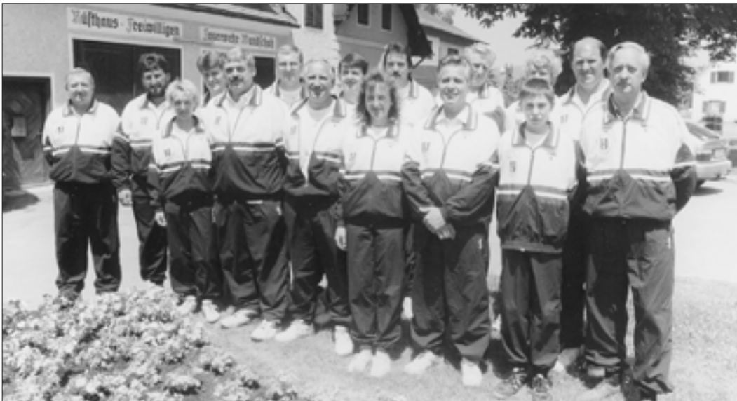
Heuer wurden 38 Trainingsanzüge angeschafft. Wir danken nochmals den Sponsoren D'Avernas, Ferk, Leber, Ofner und Raiba Wundschuh für ihren Beitrag.