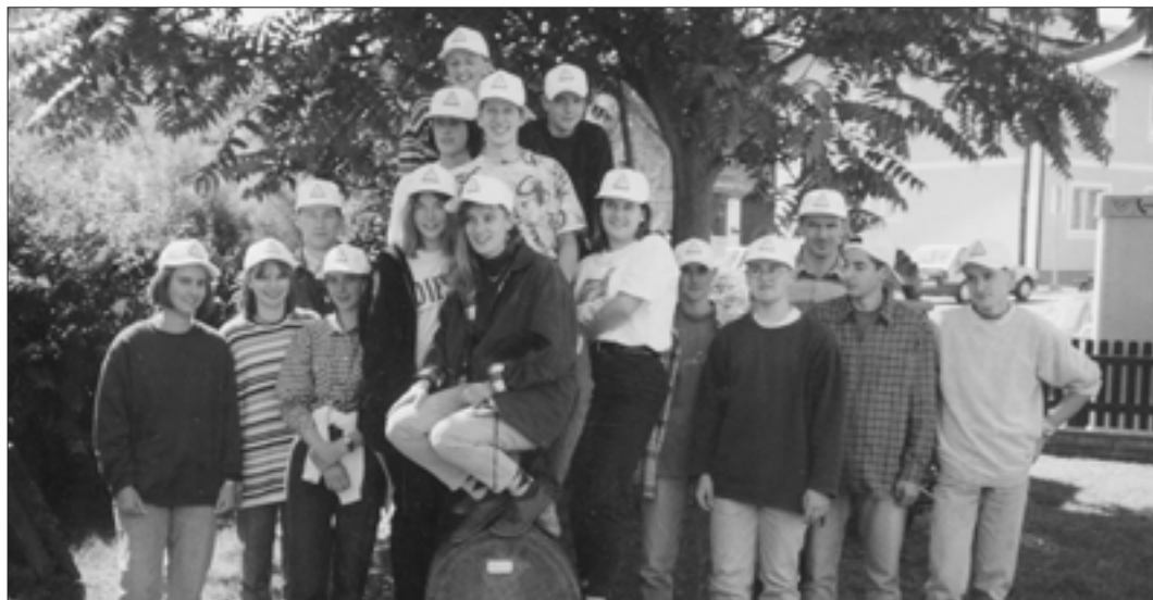
Dank der originellen Kapperln gewann die Landjugend Wundschuh beim Radwandertag des Fremdenverkehrsvereins in der Kategorie „Originelle Gruppe“ einen Geschenkkorb, dessen Inhalt von den unermüdlichen Radlern gleich vernascht wurde.

Beim Radwandertag des Fremdenverkehrsvereins am 8. September waren 20 sportliche Mitglieder live dabei. – An drei Abenden im Oktober gestalteten wir wie jedes Jahr auch heuer wieder die Erntekrone, die am Erntedanksonntag von vier starken Burschen in die Kirche getragen wurde. – Eine Woche später wanderten 30 Jugendliche nach einer kurzen Zugfahrt entlang der südsteirischen Weinstraße. Bevor wir eine kleine Karmeliter-Kapelle besichtigten, statteten wir den Bären im Bärenghege Berghausen einen Besuch ab. Strahlendes Wetter und gute Laune machten diesen Wandertag zu einem schönen Erlebnis. – Beim diesjährigen Vielseitigkeitswettbewerb der Landjugend des Bezirkes Graz-Umgebung, der sich in die vier Bereiche Allgemeinbildung, Denksport, Geschicklichkeit und Partnerbewerb gliederte, nahmen rund fünfzig Jugendliche aus verschiedenen Ortsgruppen