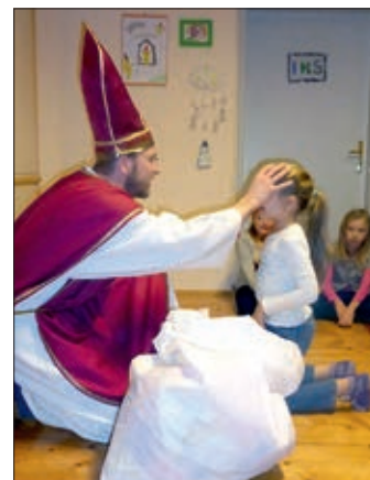
Der Hl. Nikolaus bei den Jungscharkindern