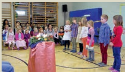
Die Kinder aller vier Klassen hatten verschiedene Beiträge vorbereitet.