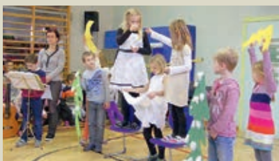
Für das Weihnachts-Minimusal gab es viel Applaus.