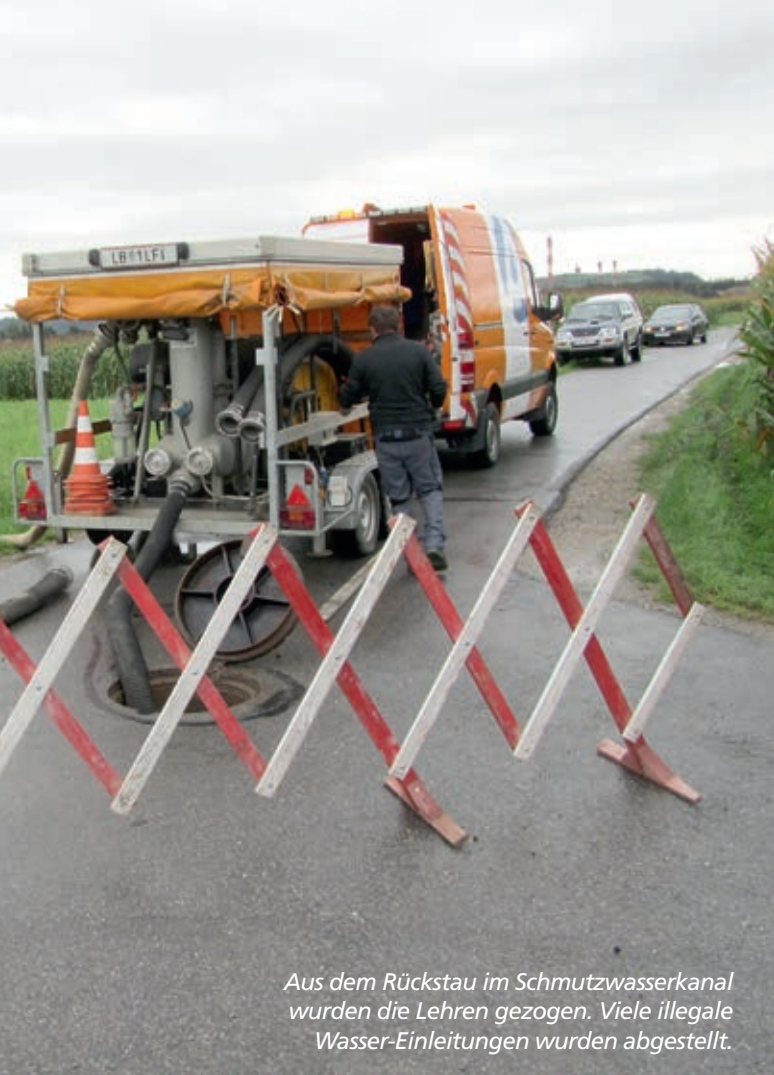
Aus dem Rückstau im Schmutzwasserkanal wurden die Lehren gezogen. Viele illegale Wasser-Einleitungen wurden abgestellt.

■ Förderung für den Einbau von Alarmanlagen. Ab 1. Jänner 2015 fördert die Gemeinde Wundschuh den Einbau von Alarmanlagen mit 20 Prozent der Kosten, maximal mit 300 Euro. Dafür muss lediglich ein Nachweis über den Einbau durch eine befugte Firma samt Rechnung vorgelegt werden.