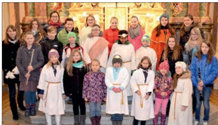
Das Finale beim Krippenspiel in der Pfarrkirche.