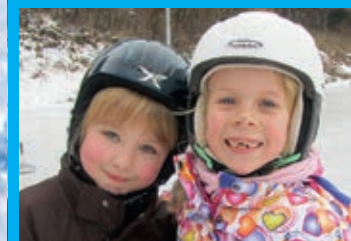
Auch diese beiden Eisprinzessinnen waren zur Eröffnung des Platzes gekommen.