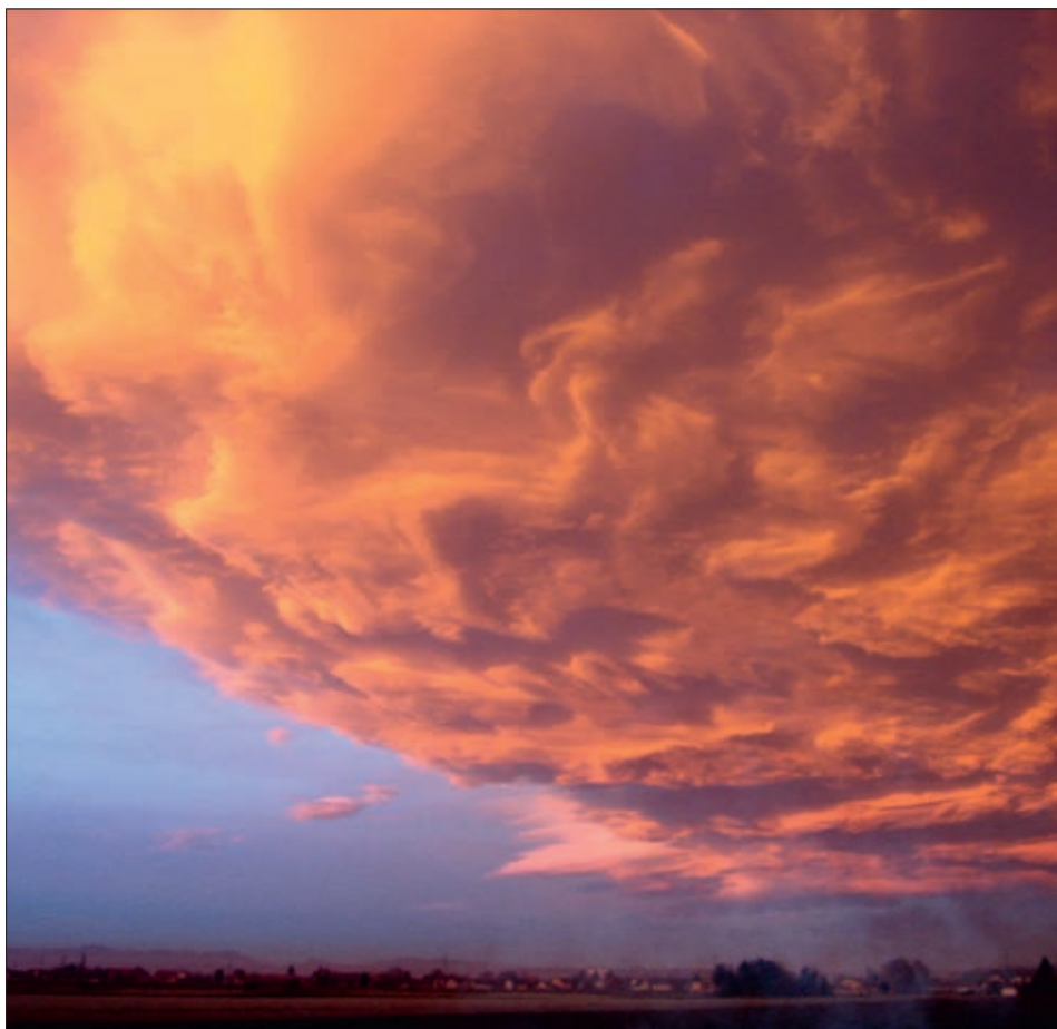
Am 29. Dezember 2014 schoss Josef Lorber aus Forst dieses traumhaft schöne Foto einer Abendrot-Stimmung über Wundschuh.