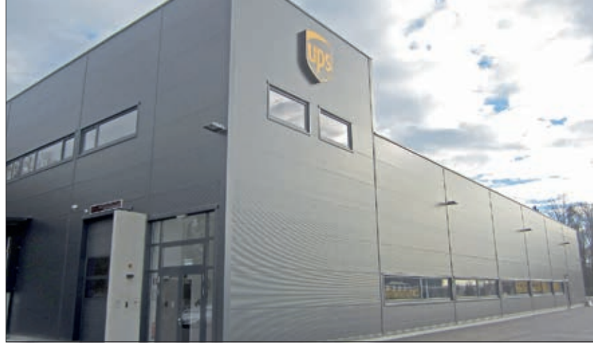
UPS ist in 220 Ländern der Welt tätig. Von Wundschuh aus werden auch zahlreiche Destinationen versorgt.

Am meisten freue ich mich, wenn sich Familien in Wundschuh neu niederlassen und lobend feststellen, dass es bei uns so viele Angebote gibt und dass bei uns vieles so unkompliziert abläuft. Das soll auch weiterhin so bleiben!