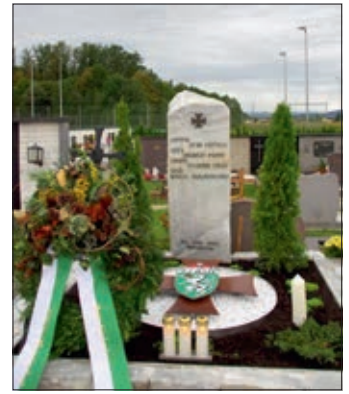
Soldatengrab am Ortsfriedhof Wundschuh

Am Sonntag, den 26. Oktober 2014, fand die Toten-Gedenkfeier unter musikalischer