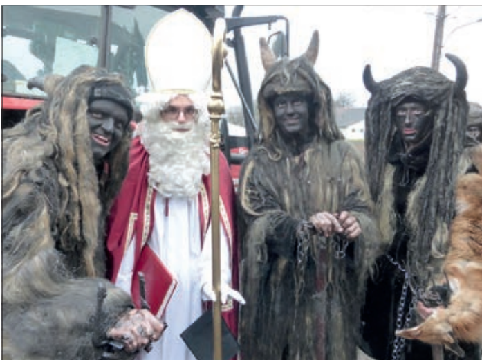
Das traditionelle Krampuspiel wird von der Landjugend veranstaltet.