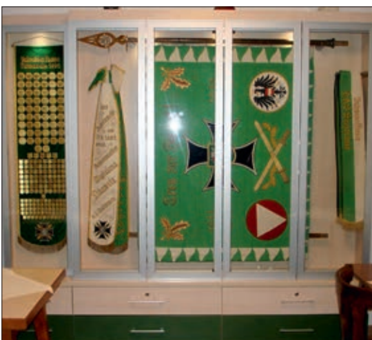
Fahnen-schrank im Vereinslokal des ÖKB Wundschuh