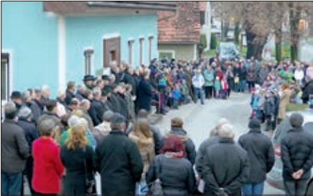
Viele Menschen bei der Gemeinde-Vorweihnachtsfeier am 8. Dezember Der Wundschuher Christbaum in seiner vollen Beleuchtung (rechts)