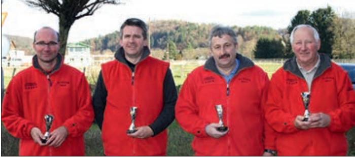
Bei der Bezirksmeisterschaft in Hart bei Graz erreichte das Quartett des ESV Wundschuh den dritten Platz.