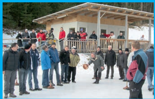
Während die einen dem Eisstockschießen frönen, schauen die anderen von der etwas höher liegenden Galerie den aktiven Schützen zu und trinken dabei einen Tee oder ein Bier.