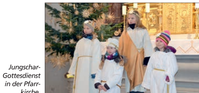
Jungschar-Gottesdienst in der Pfarrkirche.