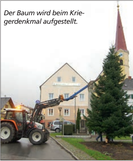
Der Baum wird beim Kriegerdenkmal aufgestellt.