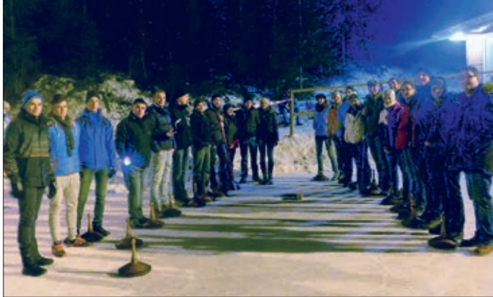
Das Eisschießen zwischen der Jungen ÖVP und der Landjugend fand bei Flutlicht auf der Gemeinde-Eisanlage am Ziegelweg statt.

Die Besucher der Christmette nahmen den Glühwein gerne an und es konnten dadurch viele Besucher begrüßt werden.