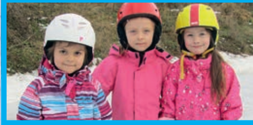
Für die kleinen und großen Kinder ist der Eislaufplatz ideal. Im Jänner gab es sogar einen Kinder-Eislaufkurs.