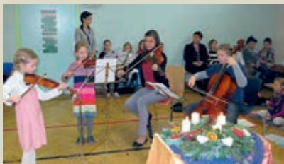
Geigenmusik, von Wundschuher Volksschulkindern gekonnt vorgetragen.