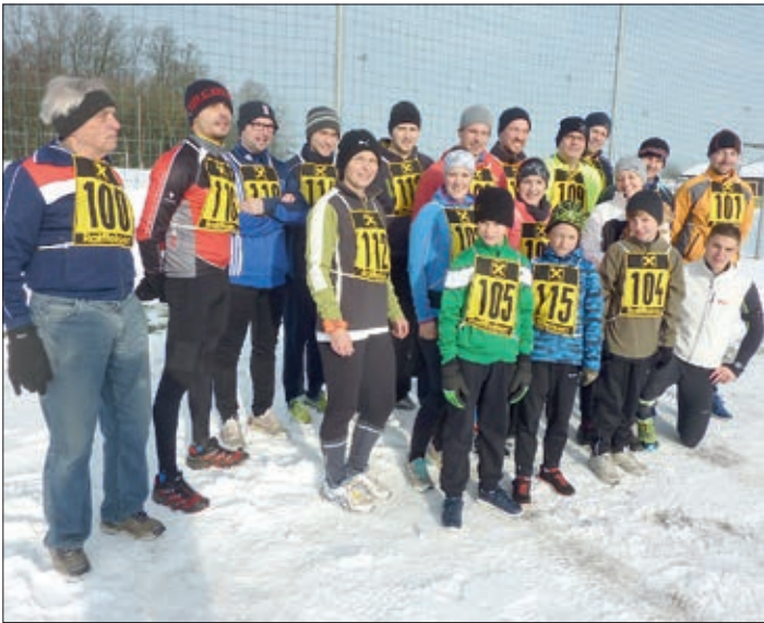
Gruppenfoto bevor es losging. Schön wäre es, wenn beim Silvesterlauf 2015 mehr Wundschuher und Wundschuherinnen teilnehmen würden. Planen Sie daher Ihr Mitlaufen mit ein!