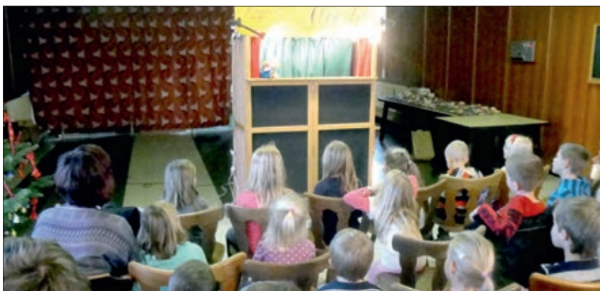
Die Kinderweihnachtsfeier der SPÖ fand im Gasthof Haiden statt.

Für ausreichende Verpflegung mit Speisen und Getränken ist gesorgt! Auch Kiebitze sind herzlich willkommen!