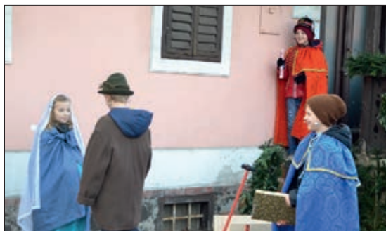
Das Krippenspiel am Hl. Abend begann beim „Blumen-Kölbl“

Stationen befanden sich heuer aufgeteilt am Weg von der Gärtnerei Kölbl Blumen bis hin zur Pfarrkirche. Zum Abschluss gab es in der Kirche noch einen Schlussegen und wir sangen gemeinsam „Stille Nacht“. Wir möchten uns auf diesem Weg bei allen Kindern und Eltern bedanken, bei allen, die uns im Hintergrund unterstützt haben, und natürlich bei allen, die so zahlreich gekommen sind, um mit uns gemeinsam die Kindermette zu feiern!