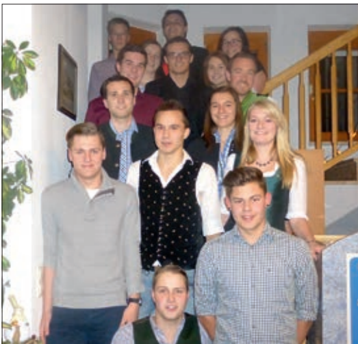
Gruppenfoto des neuen Landjugendvorstands

Der neue Fahnenschrank in unserem Vereinslokal, dem