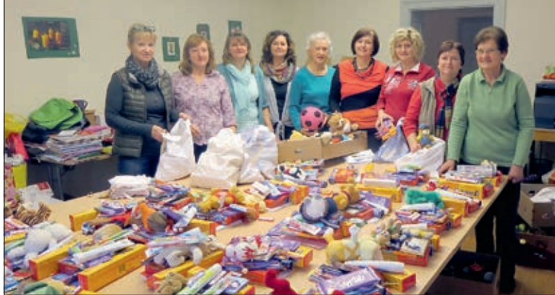
Auch heuer sammelte die Katholische Frauenbewegung viele Sachspenden und Bargeld für Arme in Rumänien.